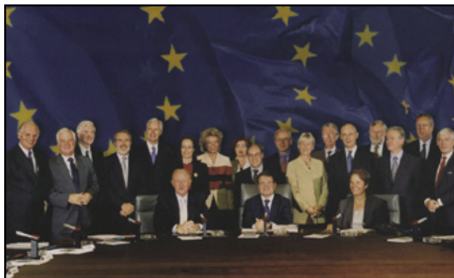
De 20 kommissærer i Prodi-Kommissionen.