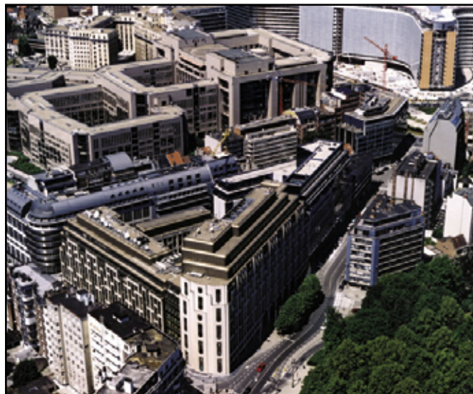
Breydel-bygningen, Europa-Kommissionens hovedkvarter

Hvis der er kvalificeret flertal imod forslaget kan Kommissionen vælge at trække forslaget tilbage, men Kommissionen kan også vedtage forslaget. Vedtages forslaget går det til Ministerrådet, der således får forelagt en vedtaget retsakt .