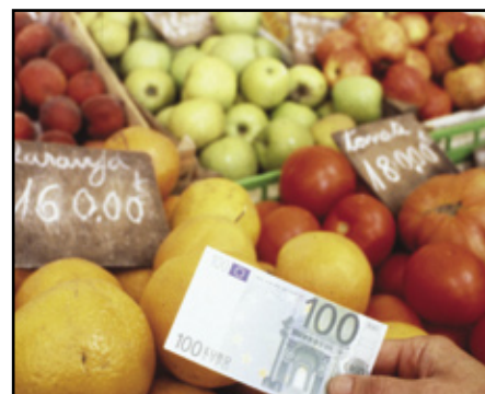
Komitologisystemet har sit udspring i EU's landbrugspolitik, der var den første fælles politik

I starten var der ikke nogen overordnet standardisering og regulering af procedurerne for Kommissionens udstedelse af regler, men i praksis opstod tre overordnede udvalgs-/komitéprocedurer for henholdsvis de rådgivende komitéer, forvaltningskomitéerne og forskriftskomitéerne. Det er principperne i de første overordnede retningslinjer, som er formaliseret i Ministerrådets afgørelser fra 1987 og 1999.